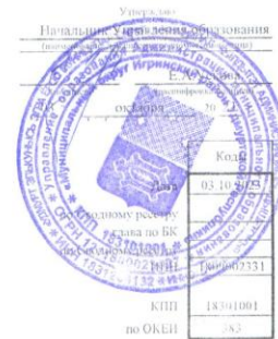
Раздел 1. Поступления и выплаты

Муниципальное бюджетное образовательное учреждение Большекуртинская основная общеобразовательная школа Учреждение: школа Единица измерения: руб.